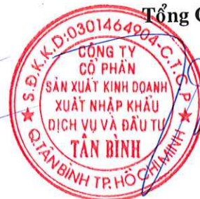
TRẦN QUANG TRƯỜNG