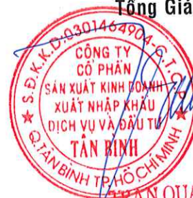
TRẦN QUANG TRƯỜNG